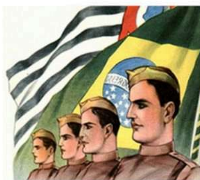
Gaviões de Penacho Edição Digital (2024)