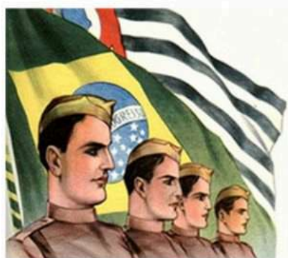
Gaviões de Penacho Edição Original (1934)

A Epopeia da Aviação Constitucionalista na Revolução de 1932