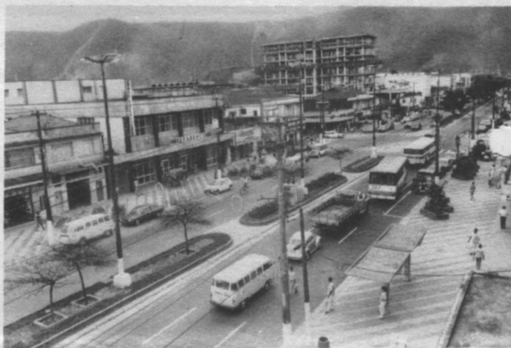
A cidade ganhará novas leis

nismos de base — sindicatos, associações, entidades da sociedade civil, partidos políticos — e agrupamentos de eleitores em número mínimo de 100. Outra proposta visa à ampla divulgação dos trabalhos, por meio de boletins e do noticiário na imprensa, para que toda comunidade seja informada do andamento, facilitando assim a sua participação.