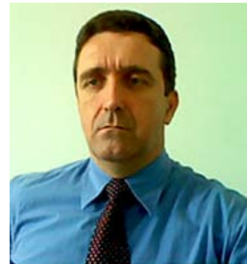
Por Anselmo Muniz Ferreira, advogado

III. idade mínima resultante da redução, relativamente aos limites do art. 40, § 1º, inciso III, alínea “a”, da Constituição Federal, de um ano de idade para cada ano de contribuição que exceder a condição prevista no inciso I do caput deste artigo”.