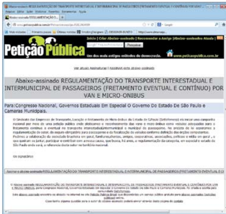
Reprodução do abaixo-assinado promovido pelo Setlofemesp

De maneira a incrementar a luta pela regulamentação da categoria, o Setlofemesp instalou um abaixo-assinado na internet, onde pede ajuda de toda a população brasileira para se atentar aos pleitos do setor. Endereçado ao Congresso Nacional, aos Governos Estaduais e, em especial ao de São Paulo, além das Câmaras Municipais, o abaixo-assinado busca, de maneira democrática, conscientizar todos dos problemas que enfrentamos nas ruas e cidades brasileiras. Para participar, basta acessar a página da internet onde o abaixo-assinado está disponível, no seguinte endereço eletrônico: http://www.peticaopublica.com.br/PeticaoVer.aspx?pi=P2013N34599