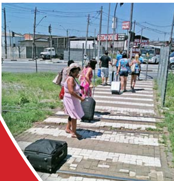
Descaso na região do Concais