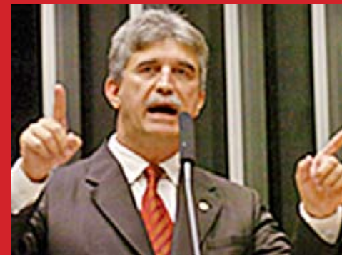
Dep. Fed. Milton Monti

Precisaremos dar apoio ao deputado, inclusive em Brasília, manifestando a posição da nossa categoria, favorável ao projeto. Vamos compartilhar isso, de maneira a atingir o maior número de colegas em todo território nacional.