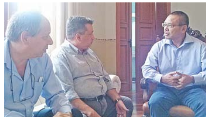
Liderança do Setlofemesp em visita ao ver. Sadao Nakai, presidente da Câmara Municipal de Santos

O Sindicato das Empresas de Transporte, Locação e Fretamento de Micro-ônibus do Estado de São Paulo—Setlofemesp, acelerou neste início de ano as visitas a diversos políticos e entidades públicas e privadas. Tendo como principal pauta a busca da regulamentação do setor e a soluções para problemas pontuais enfrentados pelos empresários sindicalizados. Por exemplo, a falta de bom senso nas operações realizadas no Terminal de Passageiros Giusfredo Santini—Concais, em Santos/SP, onde nossos veículos são proibidos de exercer duas funções básicas: a primeira, a busca dos passageiros que mantém acordos com nossos empresários; enquanto a segunda, além de afetar diretamente as empresas da região da Baixada Santista, tem se mostrado no mínimo bizarra, que é a proibição dos passageiros em buscarem nas vans uma alternativa para o turismo local, com o tradicional city tour pelos principais pontos turísticos da região, como também a visita aos shoppings, bares e restaurantes da região. Em suma, uma proibição por