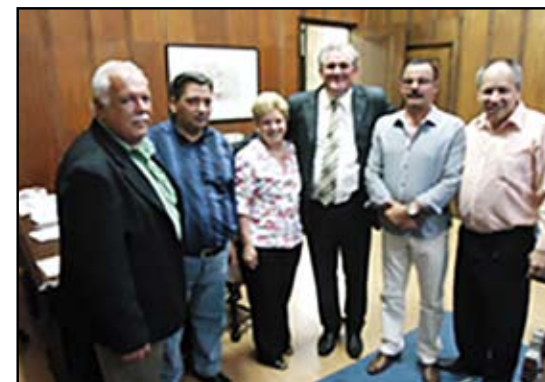
Setlofemesp na Casa Civil