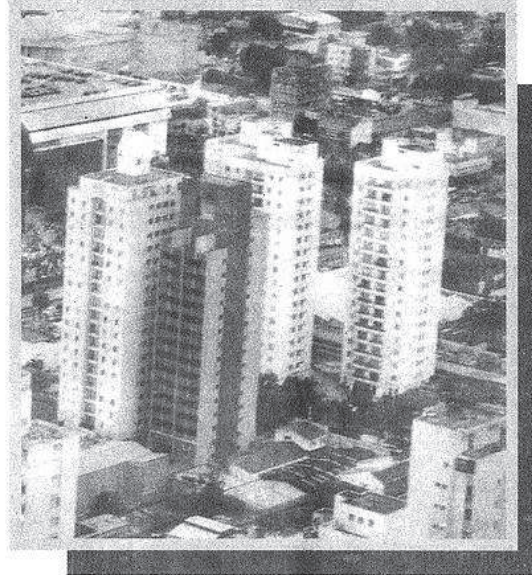
A vistoria prévia do imóvel pode evitar problemas.