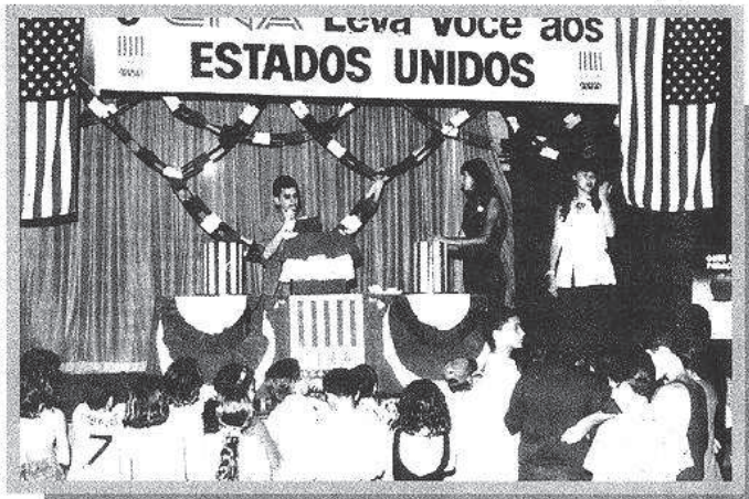
Alunos são premiados durante festa de confraternização

Com um pouco de sorte, é capaz de voltar com os autógrafos destes astros na bagagem. Agora é só fazer a matrícula e ficar torcendo.