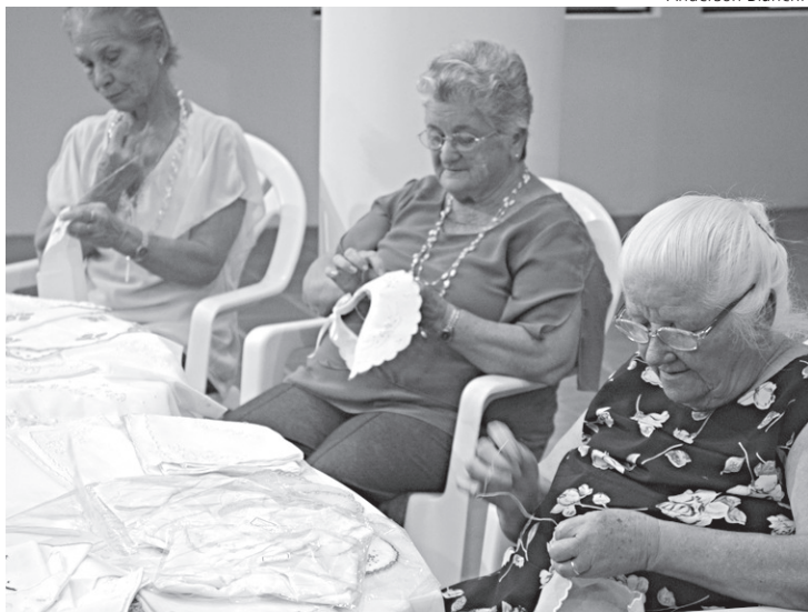
Trabalho manual preserva cultura da Ilha da Madeira