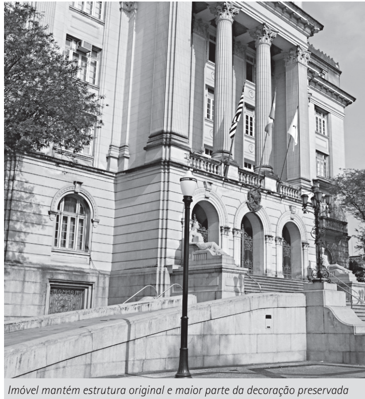
Imóvel mantém estrutura original e maior parte da decoração preservada