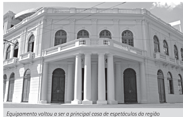
Equipamento voltou a ser a principal casa de espetáculos da região