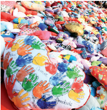
Obra retrata o ato do amor fraterno

Dentro dos festejos, hoje, a partir das 19h, no foyer do Coliseu, será lançado o livro 'O Dia do Amor: Diário da Ação do Coração', com 313 imagens do evento realizado em agosto de 2012, na Praça Mauá, com público de 26 mil pessoas e quase 60 mil corações artesanais. A entrada é gratuita.