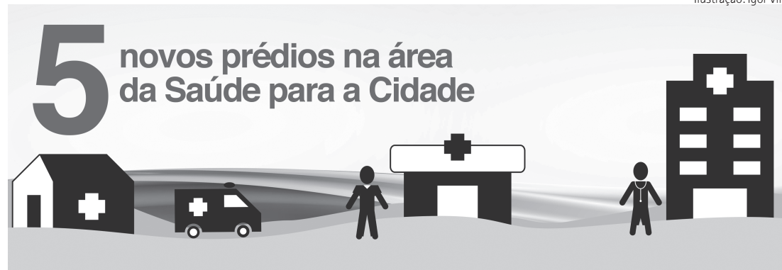
Ilustração: Igor Villa

A verba proveniente do Dade (Departamento de Apoio ao Desenvolvimento das Estâncias), do Governo do Estado, será destinada a 11 projetos, com investimentos de R$ 31,9 milhões para melhoria da infraestrutura e qualidade de vida da população, priorizando morros e zona noroeste.